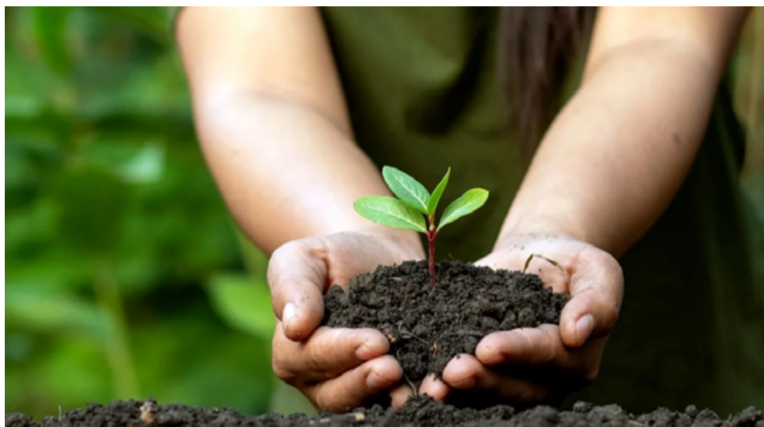
As atividades serão encerradas no dia 15 de junho com a realização da Parada Ecológica no Barro Amarelo, a partir das 8h

A primeira fase das atividades, que ocorrerá até o dia 11 de junho, inclui a doação de mudas para plantio. As doações estão sendo realizadas na Secretaria de Meio Ambiente, das 7h às 15h, incentivando os moradores a contribuírem para o aumento da vegetação local. Essa ação visa promover o reflorestamento e a criação de áreas verdes na cidade, contribuindo para a melhora da qualidade do ar e a biodiversidade local.