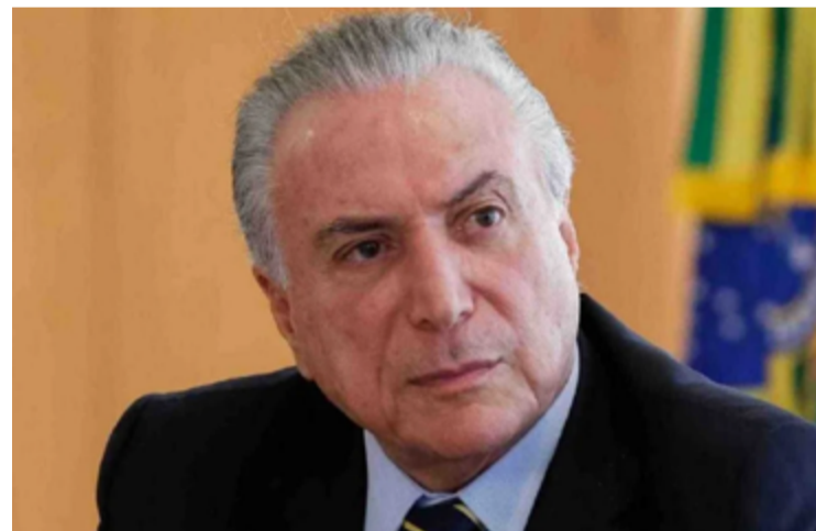
Michel Temer: ex-presidente da República