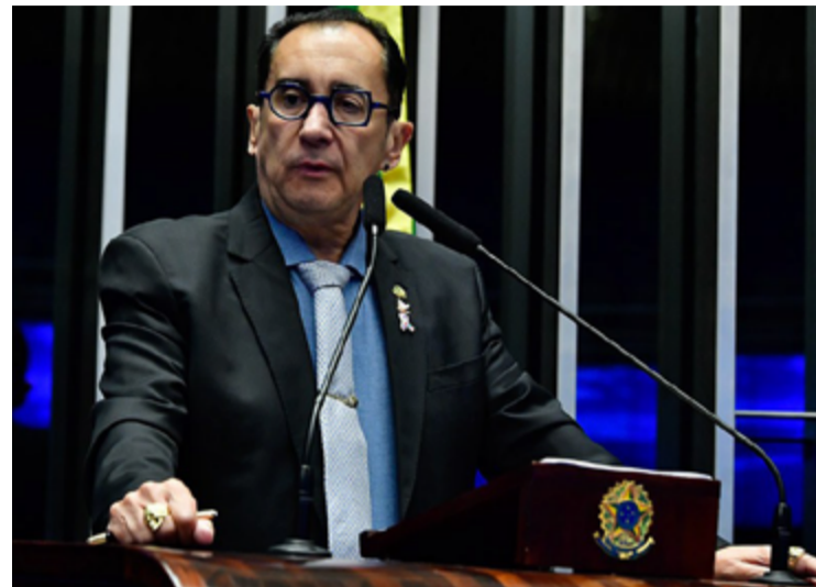
Jorge Kajuru: acusado de fala machista no Senado