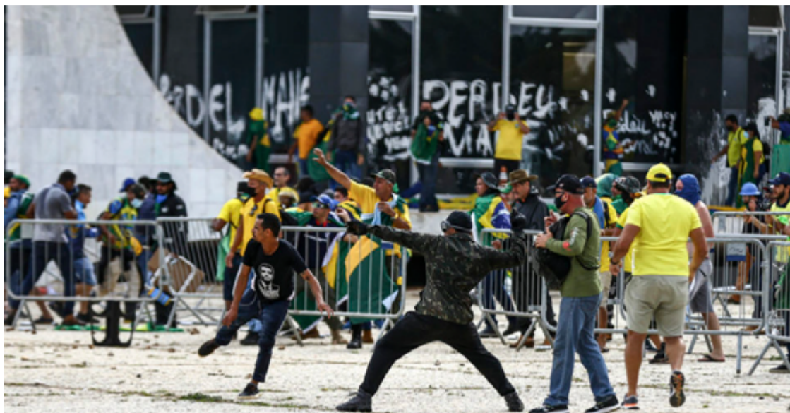
Golpistas na Praça dos Três Poderes, em Brasília; tentativa de golpe de estado

Até o momento, 48 pessoas foram presas nos estados do Espírito Santo, São Paulo, Mato Grosso do Sul, Mato Grosso, Goiás, Minas Gerais, Bahia, Paraná e no DF. A polícia continua no processo de localizar e capturar outros 170 condenados ou investigados considerados