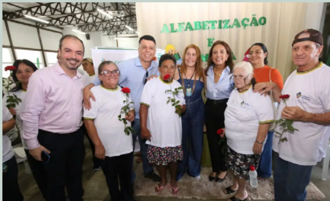
Coordenadora do Goiás Social, primeira-dama Gracinha Caiado prestigia evento do projeto Alfabetização e Família: “O estudo é a grande oportunidade que se tem na vida”

As novas turmas serão ofertadas com o apoio de prefeituras, centros de referência de Assistência Social (CRAS) e instituições parceiras. Essas instituições são responsáveis por organizar