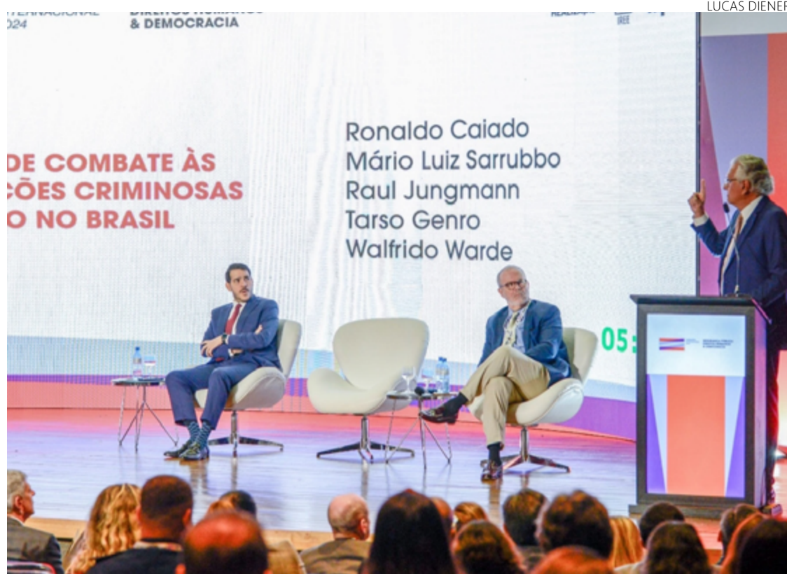
Ronaldo Caiado participa de seminário sobre segurança pública em Brasília: "Querem desviar o assunto"