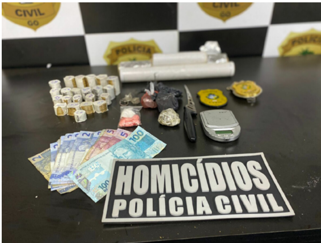
Durante a operação, a polícia encontrou a investigada em flagrante com uma quantidade significativa de entorpecentes

Durante a operação, a polícia encontrou a investigada em flagrante com uma quanti-