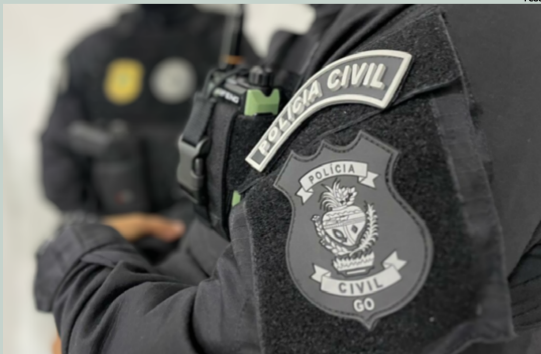
A Operação Keres, dentro da qual estas ações se inserem, é uma iniciativa abrangente que visa intensificar o enfrentamento a crimes graves em todo o estado de Goiás

No Setor Vale das Andorinhas, em Novo Gama, os policiais civis cumpriram um mandado de prisão preventiva emitido pela 1ª Vara Criminal de Grajaú, no Maranhão. O mandado era em desfavor de um homem acusado de homicídio qualificado, conforme o artigo 121, §2º, II do Código Penal. A captura desse indivíduo marca um passo significativo na resolução de um crime grave ocorrido em outra unidade federativa, mostrando a eficácia da cooperação entre diferentes jurisdições.