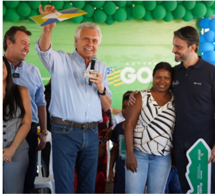
Alexandre Baldy e Ronaldo Caiado: cronograma de entregas segue em junho e julho