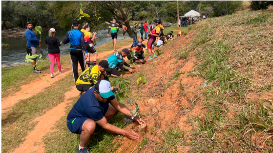
Com um trajeto de 22 km, os participantes pedalaram pelo Caminho de Cora Coralina até a Pedreira do Chico Doido

O evento não se limitou apenas à prática esportiva e ao lazer.