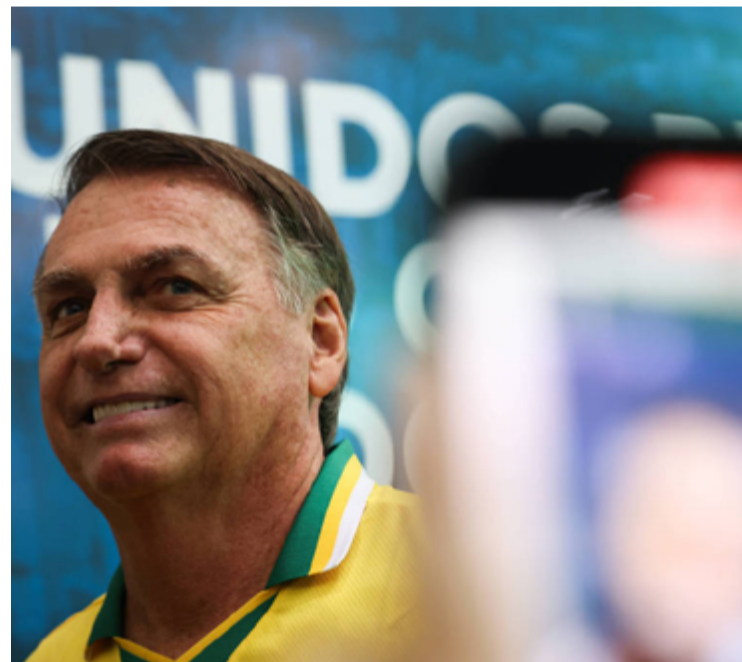
Jair Bolsonaro: STF vai julgar denúncias nas áreas criminal e civil contra ex-presidente

Após receber o parecer de Paulo Gonet, Moraes vai decidir se o inquérito contra Bolsonaro será arquivado.