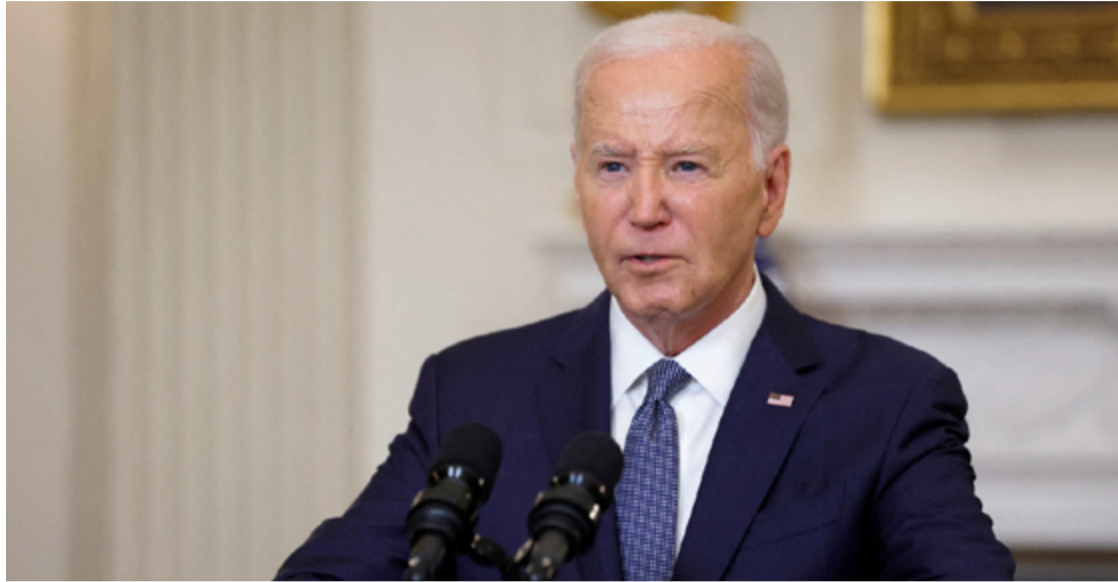
Artigo do Wall Street Journal, influente jornal econômico americano, pinta um quadro um tanto preocupante da situação do presidente

Segundo alguns, ele lia suas anotações para argumentar sobre pontos em que todos já estavam de acordo, contava a mesma anedota várias vezes,