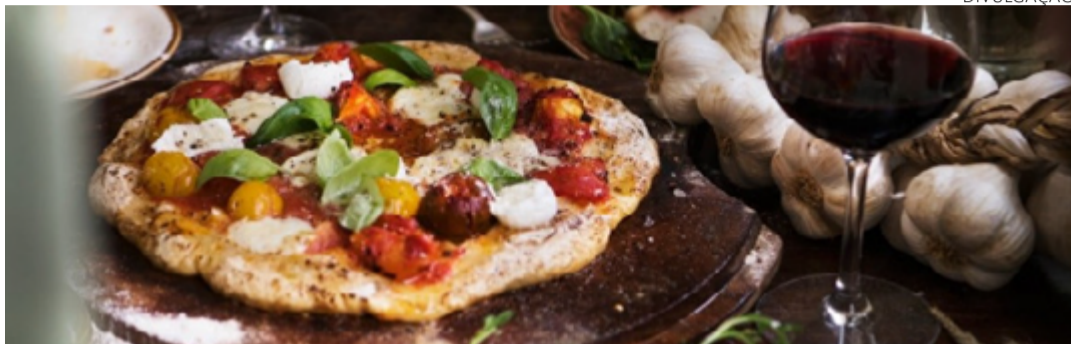
Pizza italiana se popularizou por ser simples e rápida de fazer

Se tem algo que une as pessoas é a pizza – desde a de queijo até as mais exóticas, é um amor que nunca vai acabar. Não importa a ocasião, sempre haverá um motivo para se deliciar com uma pizza e ser feliz. A história da pizza tem início há pelo menos seis mil anos atrás, provavelmente entre os egípcios e os hebreus. Ela não era, é claro, como é conhecida hoje, mas apenas um delgado estrato de massa – farinha mesclada com água –, chamado na época de ‘pão de Abrahão’, semelhante ao moderno pão sírio.