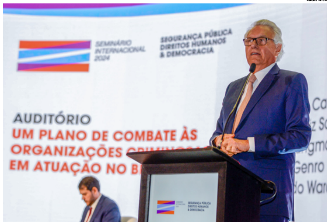
Caiado participa de seminário sobre segurança pública em Brasília: “Querem desviar o assunto”

Caiado foi um dos participantes do painel de abertura do seminário, que discutiu um plano de combate às organizações criminosas em atuação no Brasil. Durante sua exposição, o governador explicou como a segurança pública em Goiás conseguiu reduzir todos os principais índices de criminalidade nos últimos anos, com ênfase no