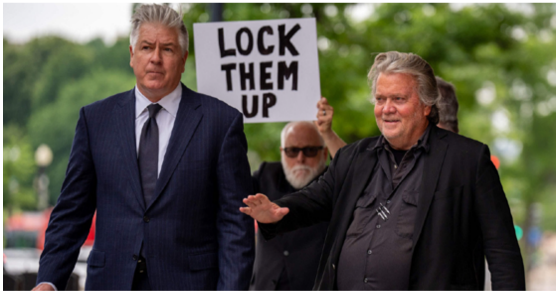
Ideólogo populista de direita, Steve Bannon (à direita), com seu advogado durante julgamento

A pena pronunciada em outubro de 2022 por obstrução aos poderes de investigação do Congresso devido à recusa de Steve Bannon em cooperar com a investigação parlamentar sobre o ataque ao Capitólio em 6 de janeiro de 2021 foi confirmada em apelação em 10 de maio de 2024.