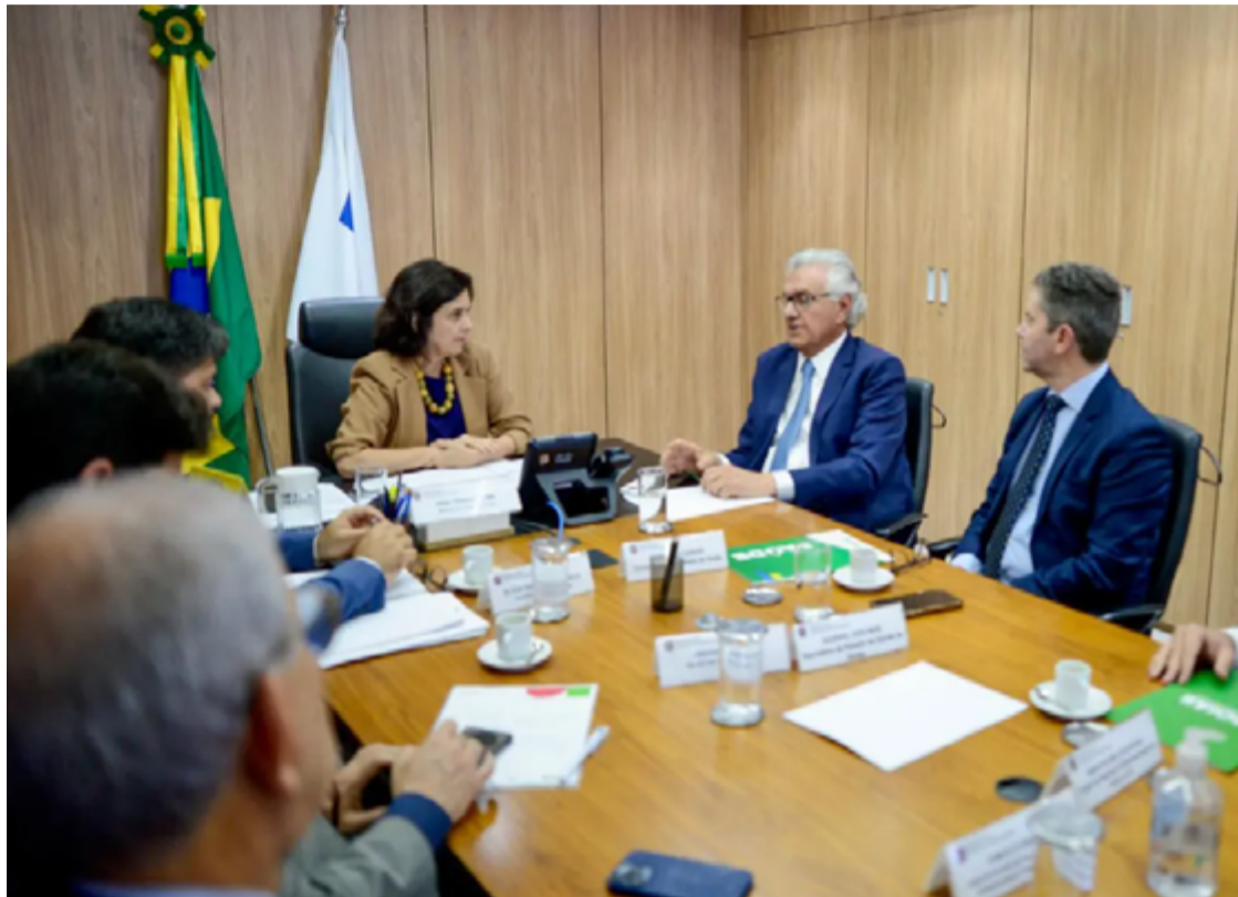
Governador Ronaldo Caiado se reúne com a ministra Nísia Trindade

O governador solicitou o repasse de R$ 55 milhões por ano para o custeio do Hospital de