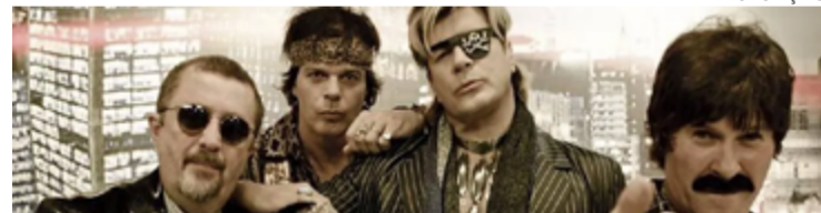
Banda explodiu nos anos 80 ao vender como Roberto Carlos