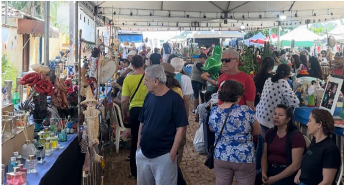
Os visitantes tiveram acesso a uma ampla variedade de itens, desde peças de artesanato tradicional até criações mais contemporâneas

A volta aos redores da Praça Santo Antônio foi recebida com entusiasmo pelos moradores e frequentadores do evento. A localização, nos entornos da igreja, é um ponto de referência e identidade para a comunidade, proporcionando um ambiente familiar e acolhedor. A decisão de retornar ao local tradicional foi vista como um resgate das raízes culturais e uma resposta posi-